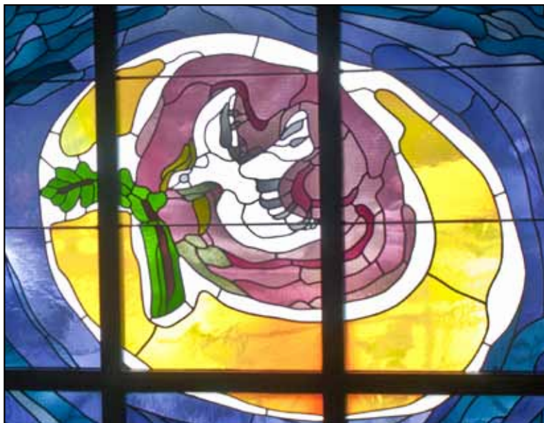
Friedenstaube im Glasfenster bei dem Marienaltar